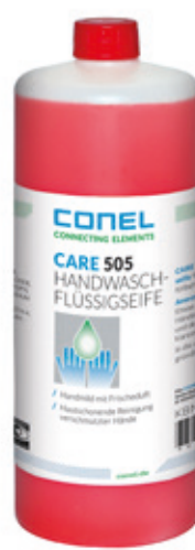
CARE 505 HAND-WASCH-FLÜSSIGSEIFE 1 LITER FLASCHE HAUTMILD CONEL