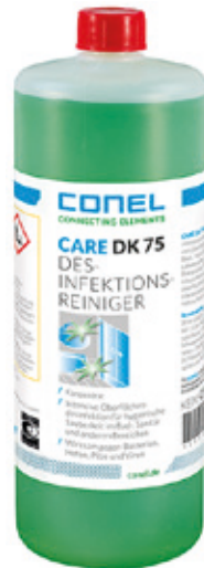
CARE DK 75 DESINFEKTIONS-REINIGER 1 LITER FLASCHE KONZENTRAT CONEL