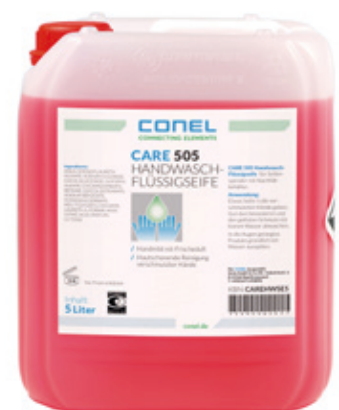
CARE 505 HAND-WASCH-FLÜSSIGSEIFE 5 LITER KANISTER HAUTMILD CONEL