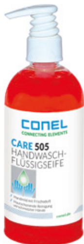
CARE 505 HAND-WASCH-FLÜSSIGSEIFE 500ML DOSIERSPENDERFLASCHE HAUTMILD CONEL