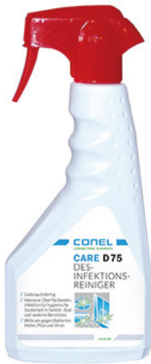
CARE DESINFEKTIONSREINIGER 500ML HANDSPRAYFLASCHE GEBRAUCHSFERTIG CONEL